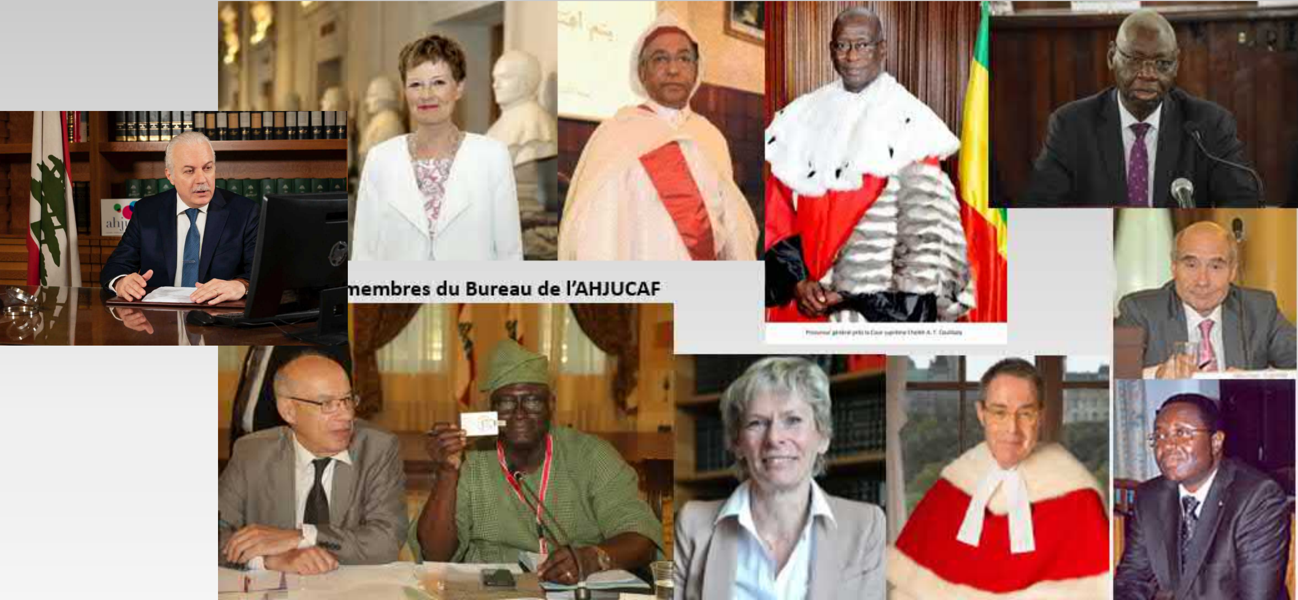
membres du Bureau de l'AHJUCAF