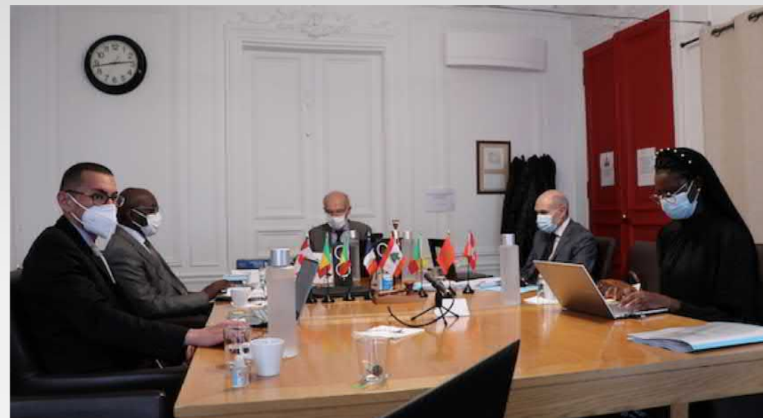
La salle de visioconférence