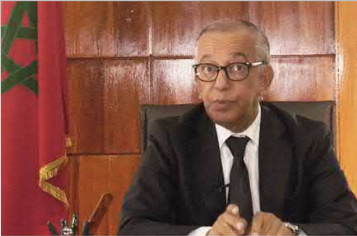
Mostafa Faress Premier président de la Cour de cassation du Maroc