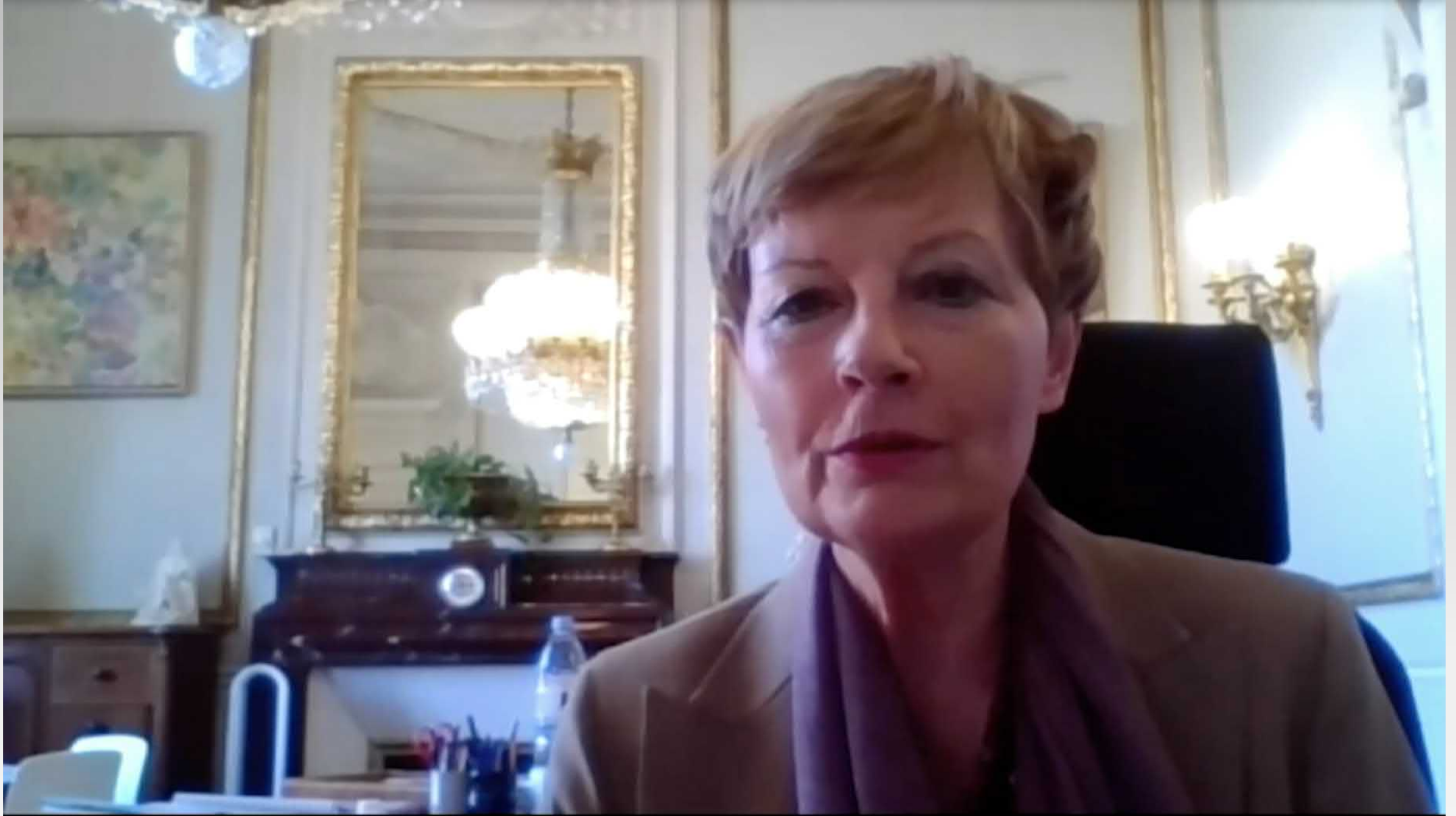
Chantal Arens Première présidente de la cour de cassation de France