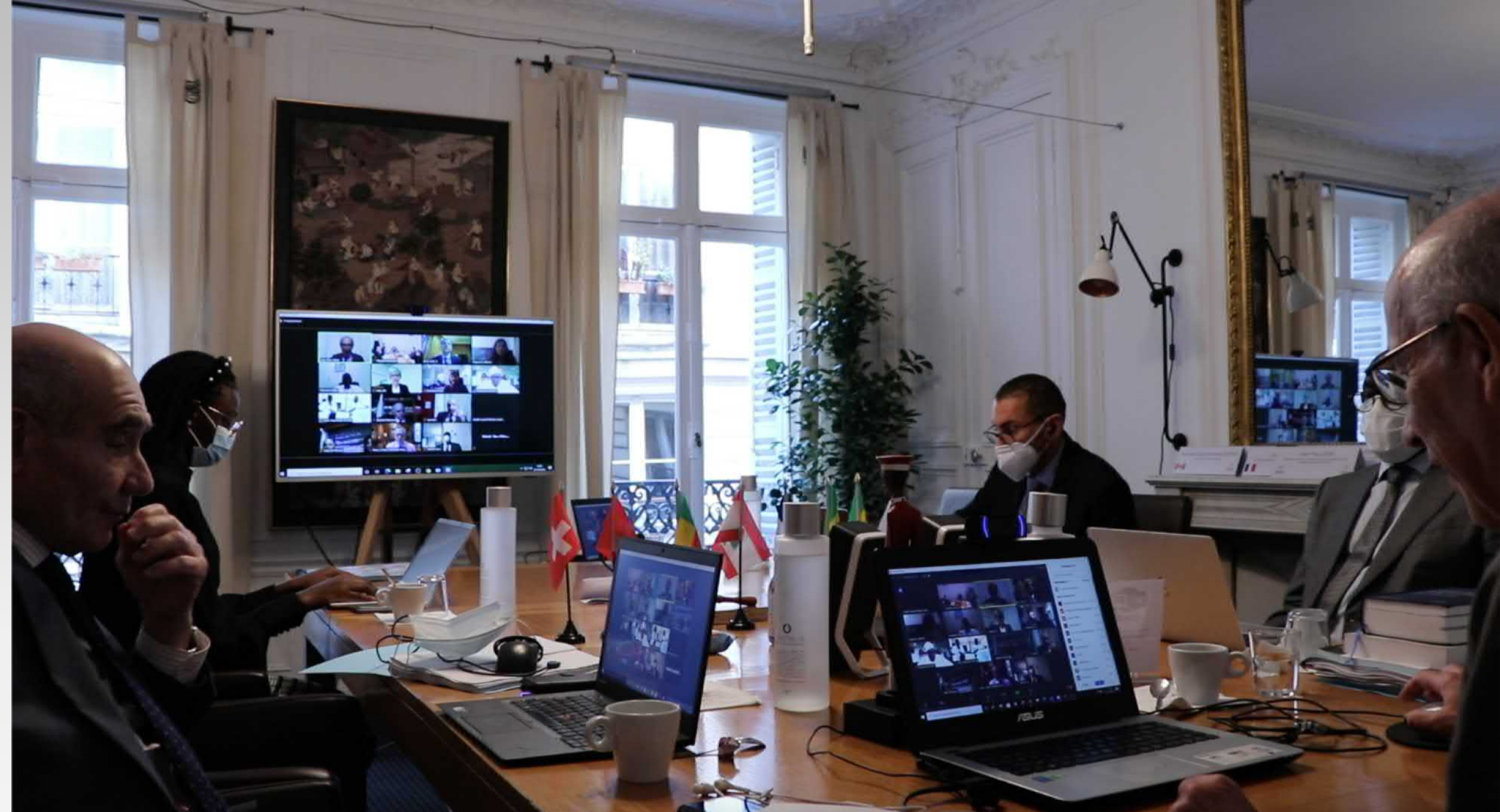
La salle de visioconférence