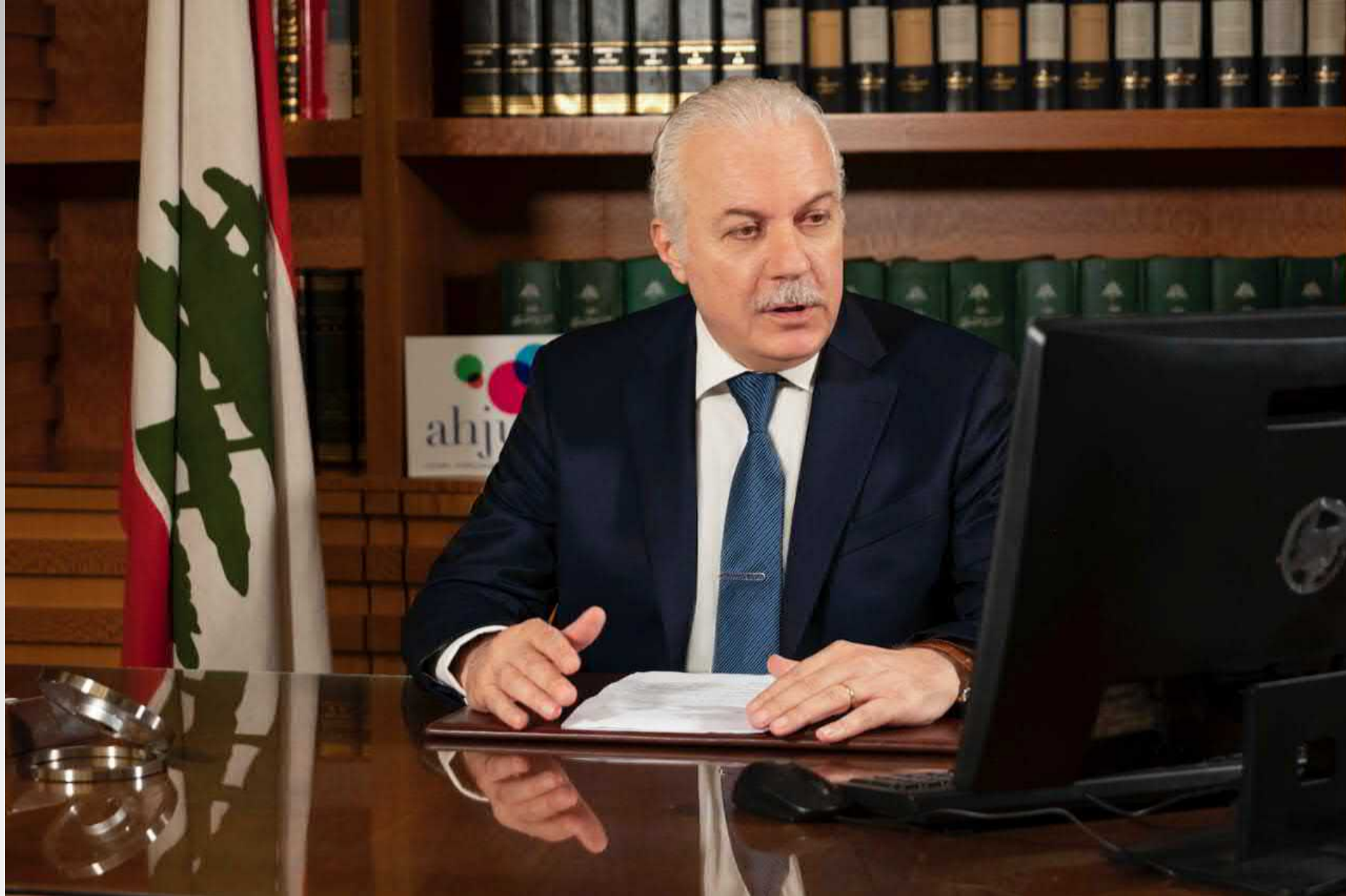
AHJUCAF réunion du Bureau du 23 octobre 2020 sous la présidence de Souheil Abboud, Premier Président de la Cour de cassation du Liban