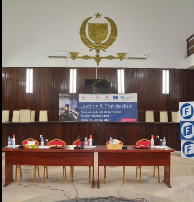
Session spéciale de formation en droit international: " Justice et Etat de droit