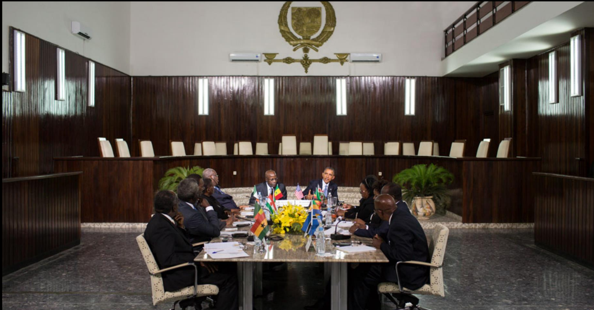
Le Président Obama à la Cour suprême, Dakar, 27 Juin 2013

"L'Afrique n'a pas besoin d'hommes forts, mais elle a besoin d'institutions fortes"