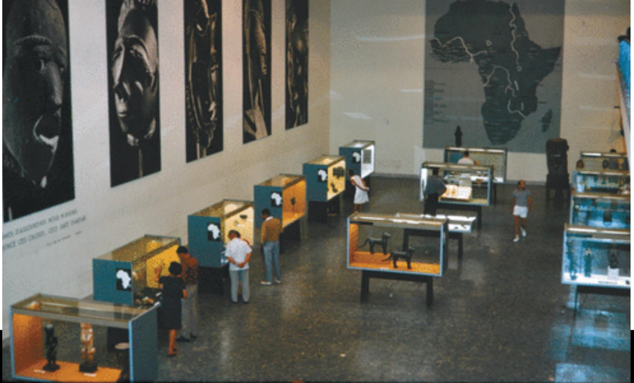
VUE D'INSTALLATION, "L'ART NÈGRE", MUSÉE DYNAMIQUE, DAKAR, 1966