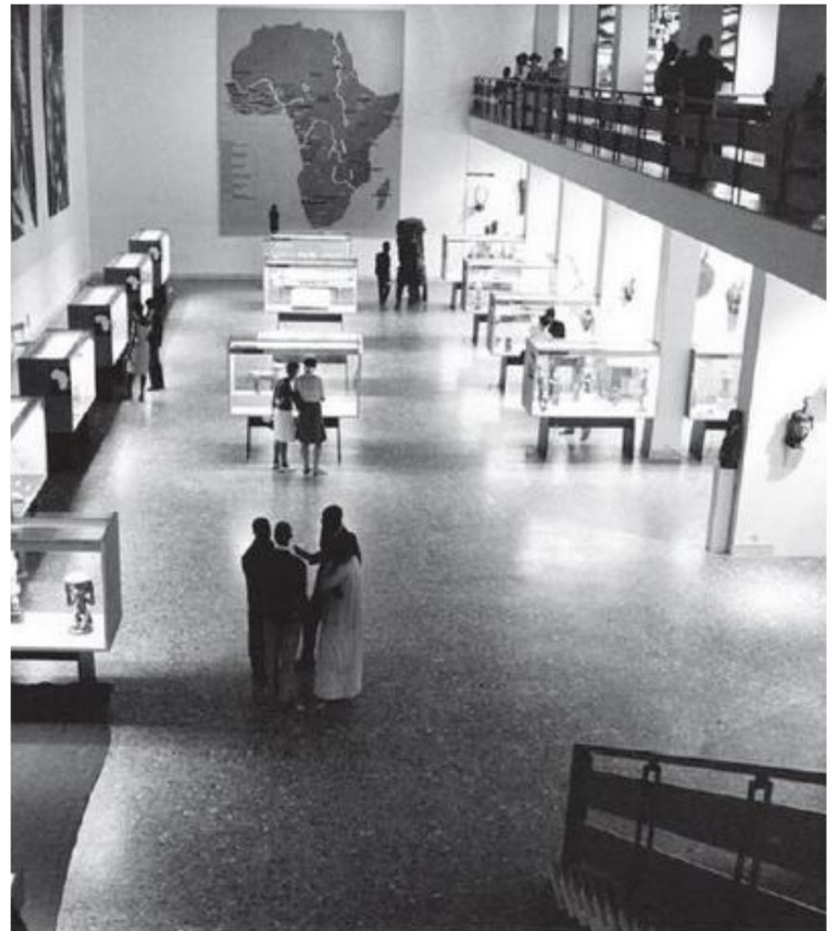
L'ART NÈGRE: SOURCES, ÉVOLUTION, EXPANSION, EXHIBITION AT THE MUSÉE DYNAMIQUE, DAKAR, 1966

Cette étude propose de revenir sur l'histoire méconnue et passionnante de ce qui fut le premier musée d'art moderne et contemporain en Afrique de l'ouest dont l'édifice appelé " Musée Dynamique " est devenu un lieu de justice: la Cour suprême