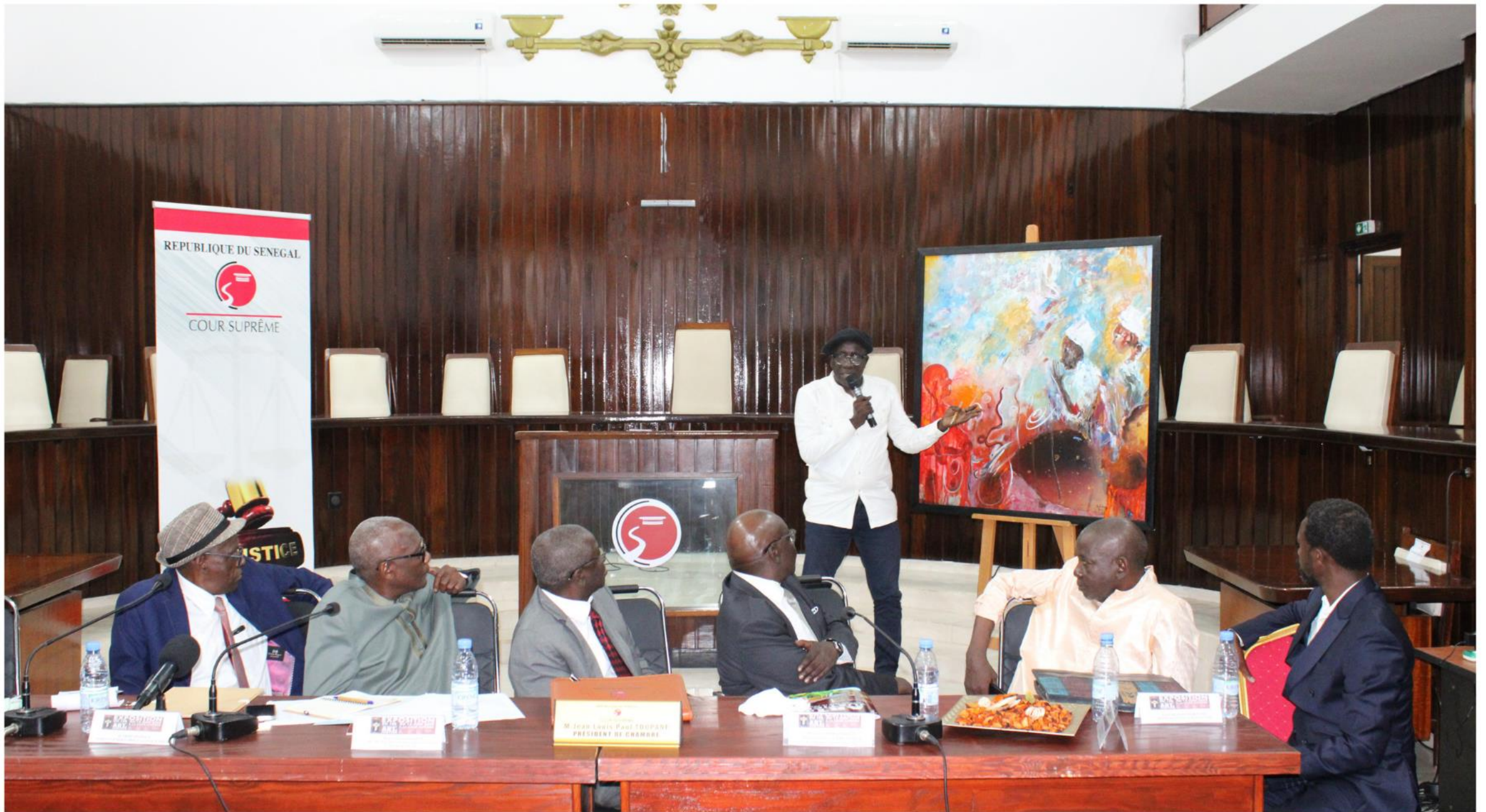
Conférence sur le dialogue entre l'Art et la Justice