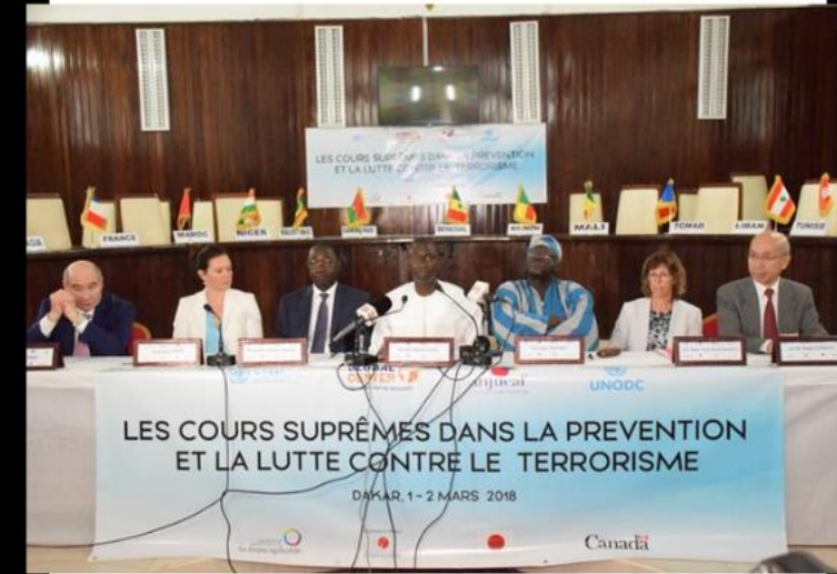
Conférence finale du projet « Les Cours suprêmes dans la prévention et la lutte contre le terrorisme » en mars 2018