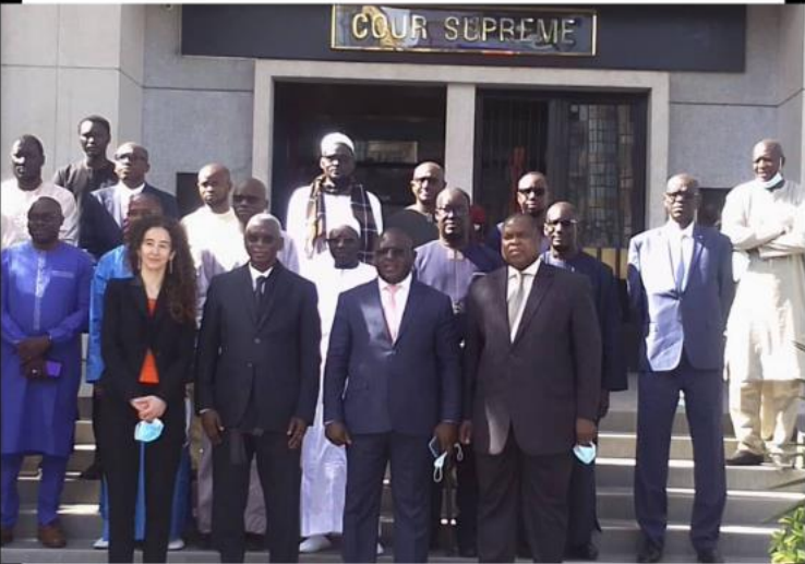
Atelier d'échanges sur le thème « La jurisprudence internationale et africaine sur la liberté d'expression et la sécurité des journalistes »